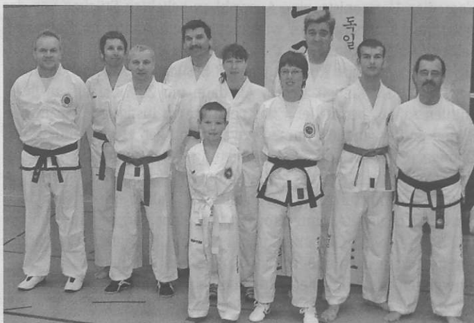
Die Teilnehmer aus Talheim